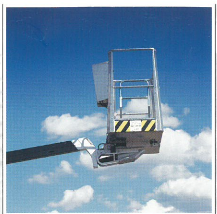
Schwenkbarer Arbeitskorb für exakte Arbeitsposition.