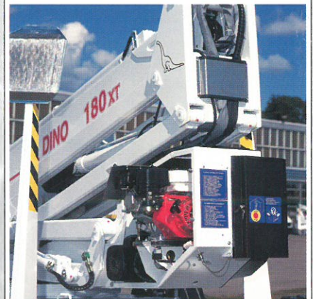
Optionaler HONDA-Benzinmotor zum netzunabhängigen Betrieb.