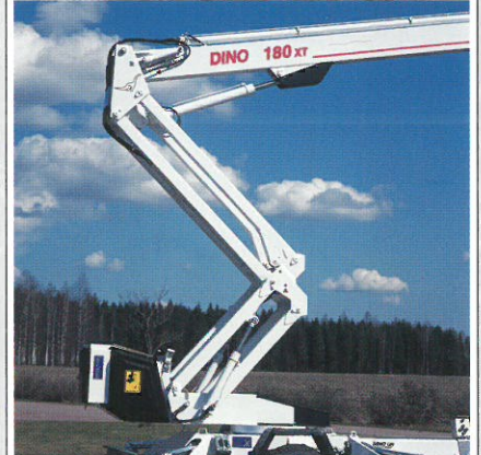
Überfahren verschiedener Hindernisse bis 2.5 m durch vertikal bedienbares Scherengelenk.